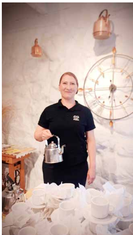
Hotelli ja tilausravintola Partalan Kuninkaan-kartanon emäntä valmiina vastaanottamaan vieraat Juvan Partalassa, lähellä keskustaa.