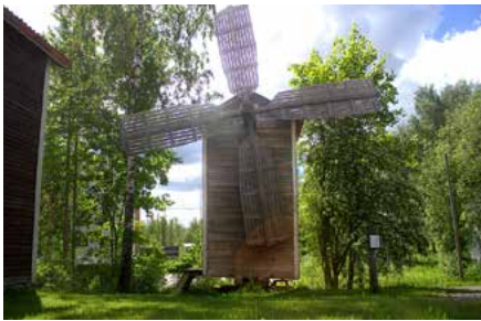
Lähes 200-vuotiset Juvan pitäjän viljamakasiini ja Lehtikankaalta siirretty tuulimylly ovat nähtävillä vanhan hautausmaan kulmalla.