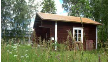
Gottlundin tuvassa Carl Axel Gottlund keräsi kansanperinnettä ja laulatti runonlaulajia 1800-luvun alussa.

Juvan keskustassa ja sen liepeillä voit nauttia luontoelämyksistä ja löytää harvinaisia kulttuurihistoriallisia kohteita. Lähde löytöretkelle Juvan järviluontoon ja kulttuuriin!