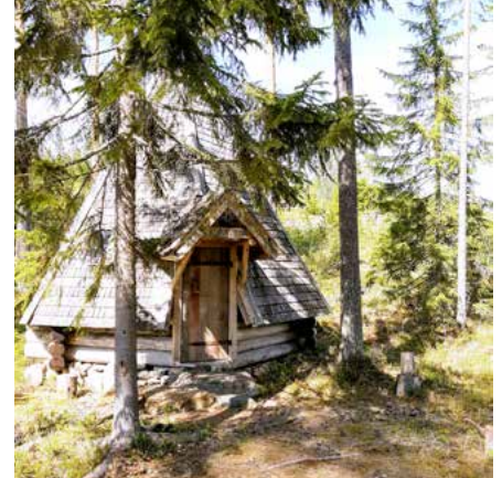
Laurinkota Metsäväentaivaleen varrella on tunnelmallinen taukopaikka.

Hiiden polkujen reitit on merkitty punaisella värillä ja viitoituksilla, ja vuorireitit keltaisin ja valkoisin tunnuksin. Reitistön varrella on taukopaikkoja ja laavuja tulentekopaikkoineen myös yöpymistä varten.