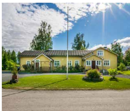
Salajärven kauniissa rantamaisemissa sijaitsevan, tunnelmallisen juhla- ja majoituskohde Kannashovin päärakennus.