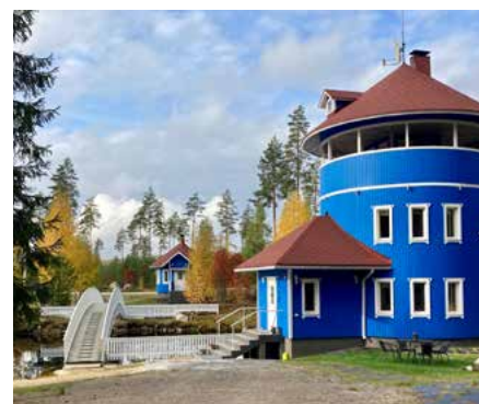
Laatulomien Villa Muu ja muut korkeatasoiset huvilat kutsuvat viihtymään vaikka koko perheen voimin.