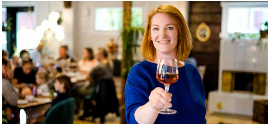
TeaHouse of Wehmais tarjoaa makumatkoja myös teen maailmaan.