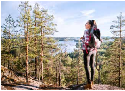
Neitvuori, Hiiden polkujen yksi näköalapaikka, tarjoaa hienot maisemat Saimaalle.

Hiiden polkujen pisin reitti, Metsäväentaival, kiertää Juvalla upeissa metsä- ja kalliomaisemissa sekä lampien ja koskien rantoja. Yhteensä 50 km pitkä reitti sopii ympärivuotiseen retkeilyyn. Sen varrella on monenlaista nähtävää, muun muassa ainutlaatuinen Saimaa Geopark-kohde Enkelinpesä luolineen sekä metsäkansan elämästä kertovia torppia kaskiraunioineen, museotiloja, savusauvoja sekä vanhoja rahtiteitä.