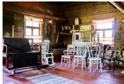
Juvan karjalaisten museo Partalassa

Pattoin perintötalo on talomuseo ja Saimaan Geopark-kohde. Pihapiiriin ja polkuihin voi tutustua omatoimisesti ympäri vuoden, kesäisin myös opastetusti.