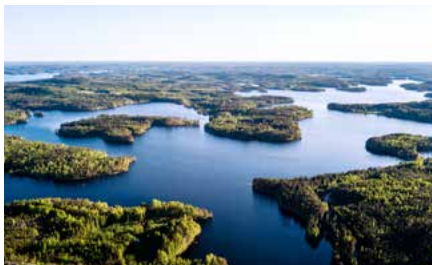
Luonterin maisemissa on ilo seikkailla.