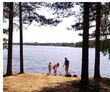
Juva Camping lähellä Juvan keskustaa.