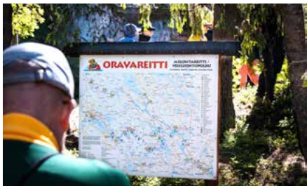
Oravareitti on hyvin opastettu myös luonnossa.

Juvalla on lukuisia järviä ja hienoja vesireittejä, joilla meloa. Niiden varrella on ainutlaatuisia Saimaa Unesco Geopark -kohteita, rantoja ja taukopaikkoja, joissa levähtää ja nauttia upeista maisemista.