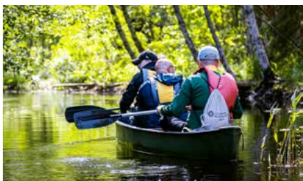
Leppoisa Oravareitti sopii koko perheelle.

Reitille voi lähteä joustavasti miltä tahansa taukopaikalta. Reitin varrella on useita taukopaikkoja, joissa on tulente-komahdollisuus. Kuljetukset kohteisiin ja takaisin voi sopia välinevuokraajien kanssa. Myös majoitus ja ruokailut järjestyvät tarvittaessa.