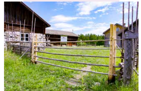
Pattoin perintötalon pihapiiri

Tutustu Partalan historiaan skannaamalla polun varrella olevat kahdeksan QR-koodia. Kerää vastaussivuilta löytyvät kirjaimet ja vaihda niiden järjestystä, niin saat tietää, mitä tuotetta herrasväen pöydissä käytettiin 1500-luvun kuninkaankartanossa.