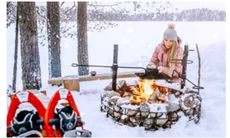
Sepittäjän kierroksen tulipaikka.

Sepittäjän kierros on helppokulkuinen, Salajärven rantamaisemissa lähellä Juvan keskustaa kiertelevä, juvalaista järviluontoa opastauluin esittelevä 2 km mittainen luontopolku. Reitin varrella on uusi tulipaikka varusteineen sekä uimaranta. Sepittäjän kierros on osa Gottlundin kierrosta.